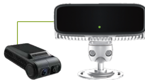
外部機器接続例：産運転警告システム